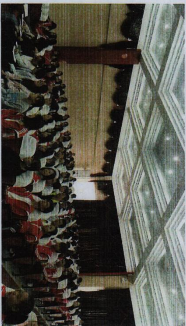
※工艺美术专业老师与专业部学生们呀囫窗展示设计讲座