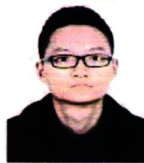
(请在此处粘贴照片)

此证书作为持证者参加培训或通过知识考核的证明, 是个人学习和更新知识的有效依据 (非职业资格类证书), 由本人保存, 不得自行填写、涂改、伪造和转借他人。