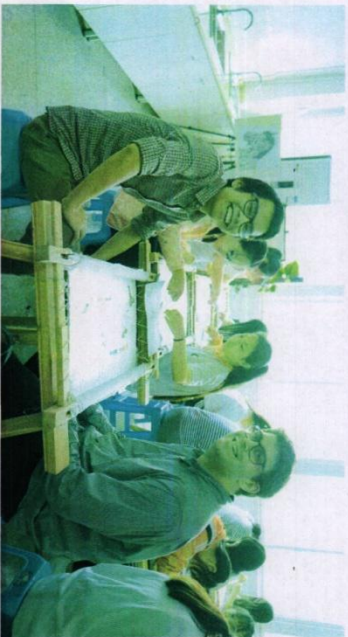
※温莎大学留学生到我校参观蜀绣大师工作室