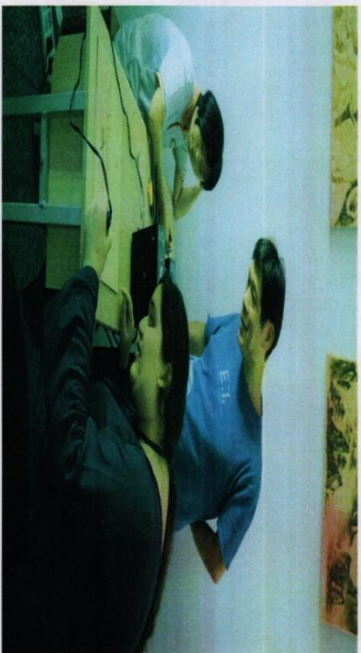
※温莎大学留学生到我校参观烙画大师工作室