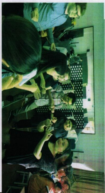
※温莎大学留学生到我校参观大师工作室