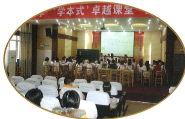
“卓越课堂”教学擂台赛