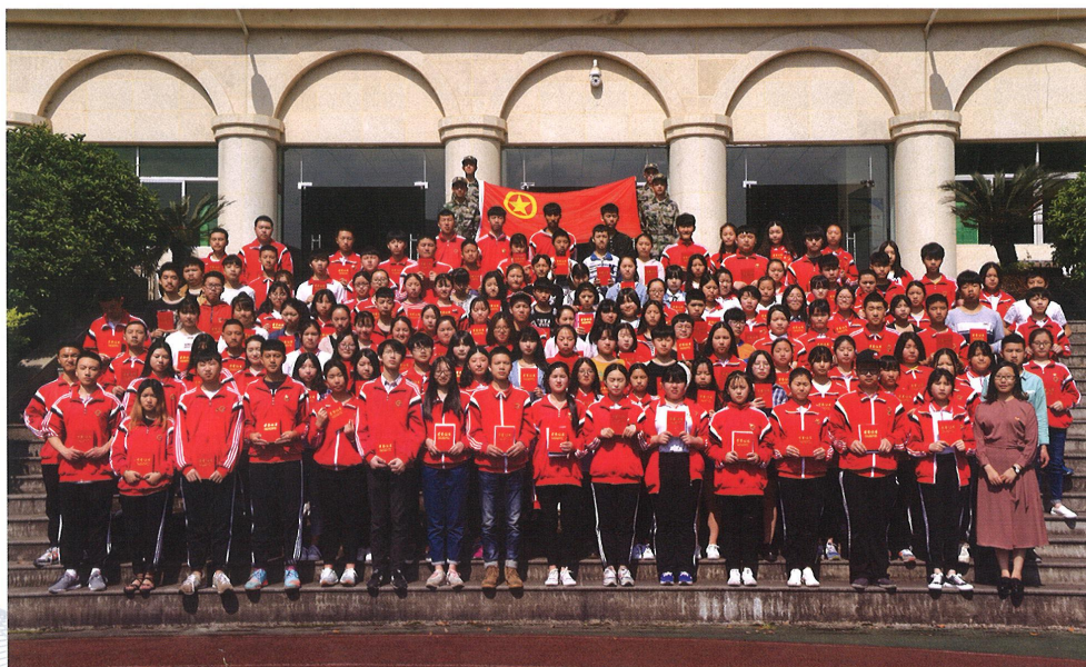
重庆市工艺美术学校五四入团团员合影