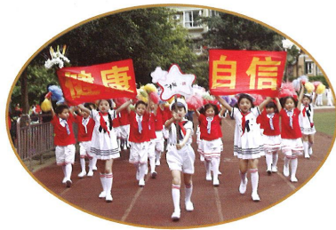
南开“公能杯”运动会