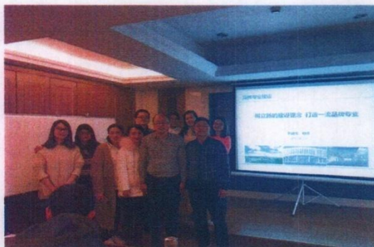
我校教师与专家合影