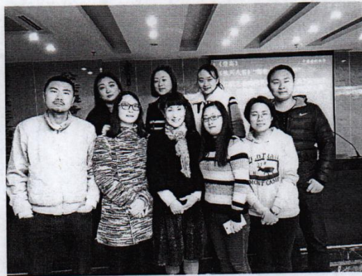
培训学员与老师合影