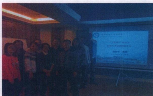
我校教师与专家合影