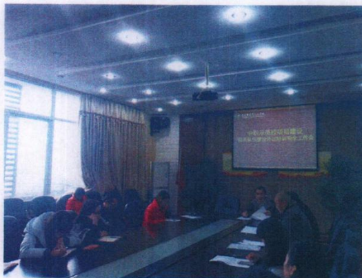
师资队伍建设外出培训安全会

根据示范校建设的进度安排和学校实际情况，3月17日-19日、3月24日-26日，学校组织部分专业（学科）带头人及骨干教师培养对象，分别赴济南、扬州参加了教师综合素质提升培训（全国职业院校品牌（重点）专业（群）建设与实操高级研修班）。培训前，学校教师发展中心制定了详细的培训方案并召开了师资队伍建设外出培训安全会。