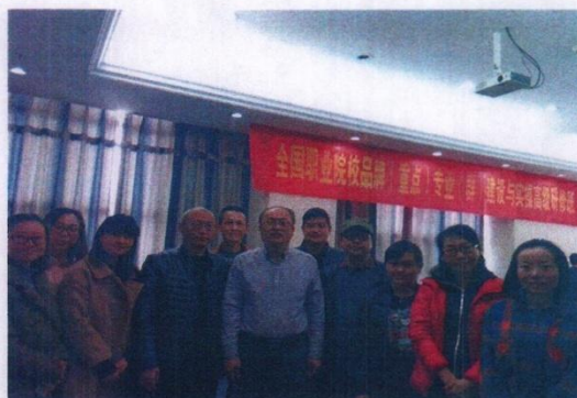
我校教师与专家合影