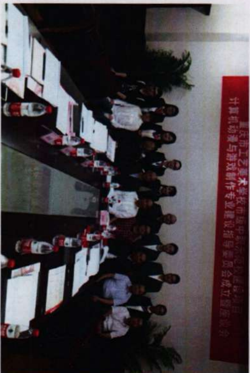
※全体专家与计算机动漫与游戏制作项目组成员合影