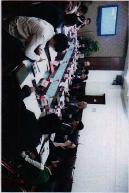
※《计算机动漫与游戏制作》专业建设指导委员会成立暨座谈会