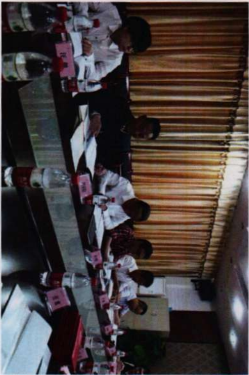
※专家与计算机动漫与游戏制作项目组成员交流