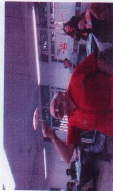
※SCL培训中外交Neil教授展示小组作品