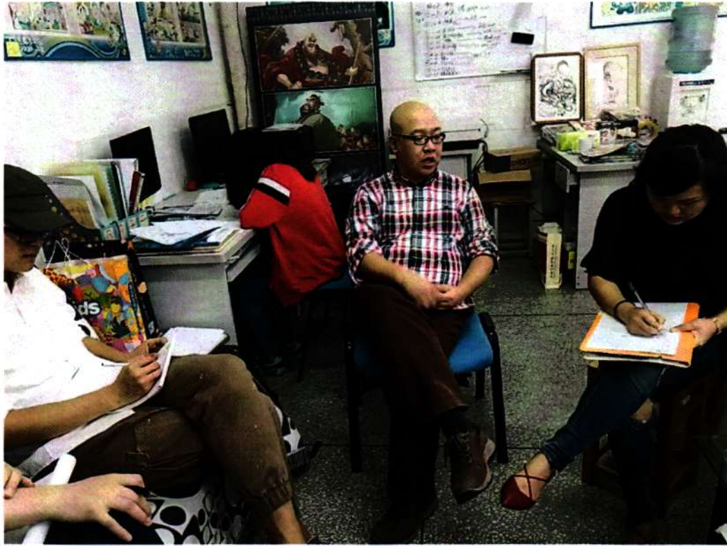
※计算机动漫与游戏制作项目组成员讨论