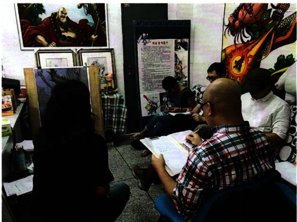
※计算机动漫与游戏制作项目组成员讨论