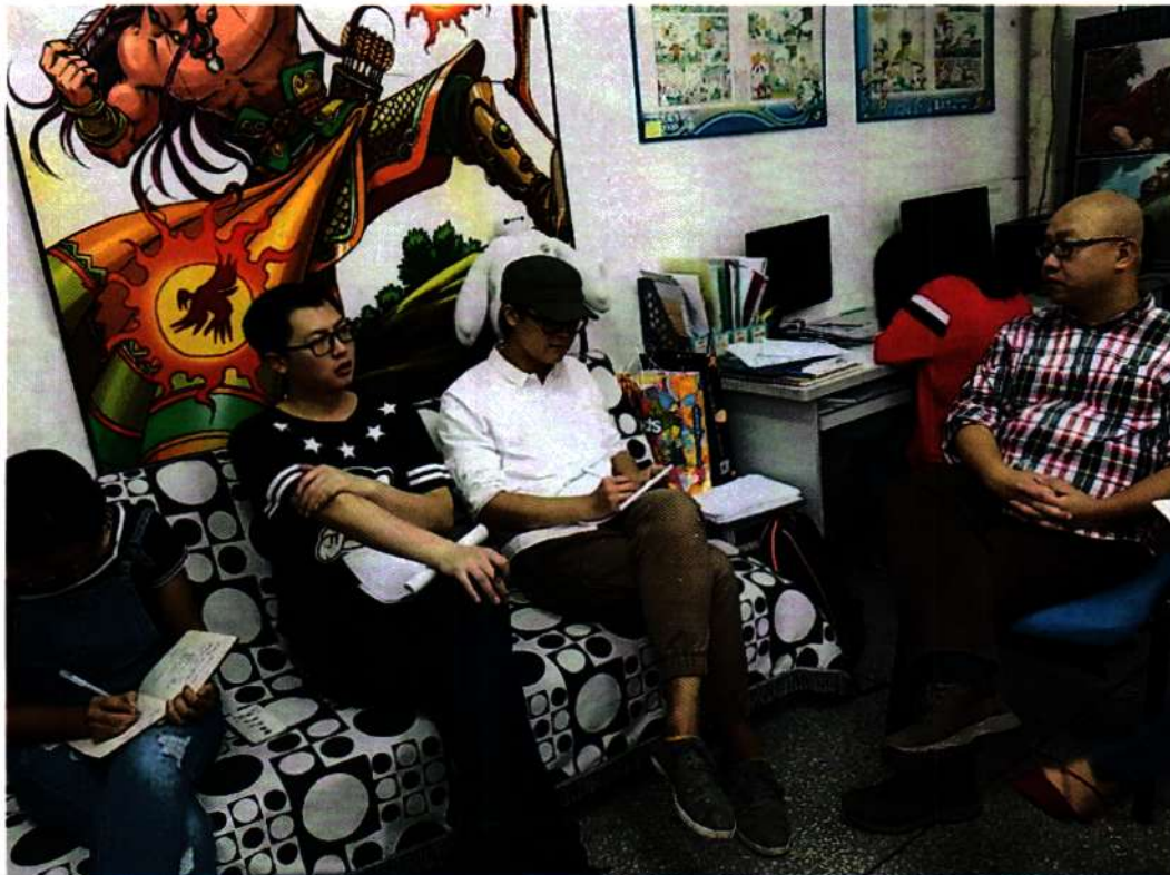
※计算机动漫与游戏制作项目组成员讨论