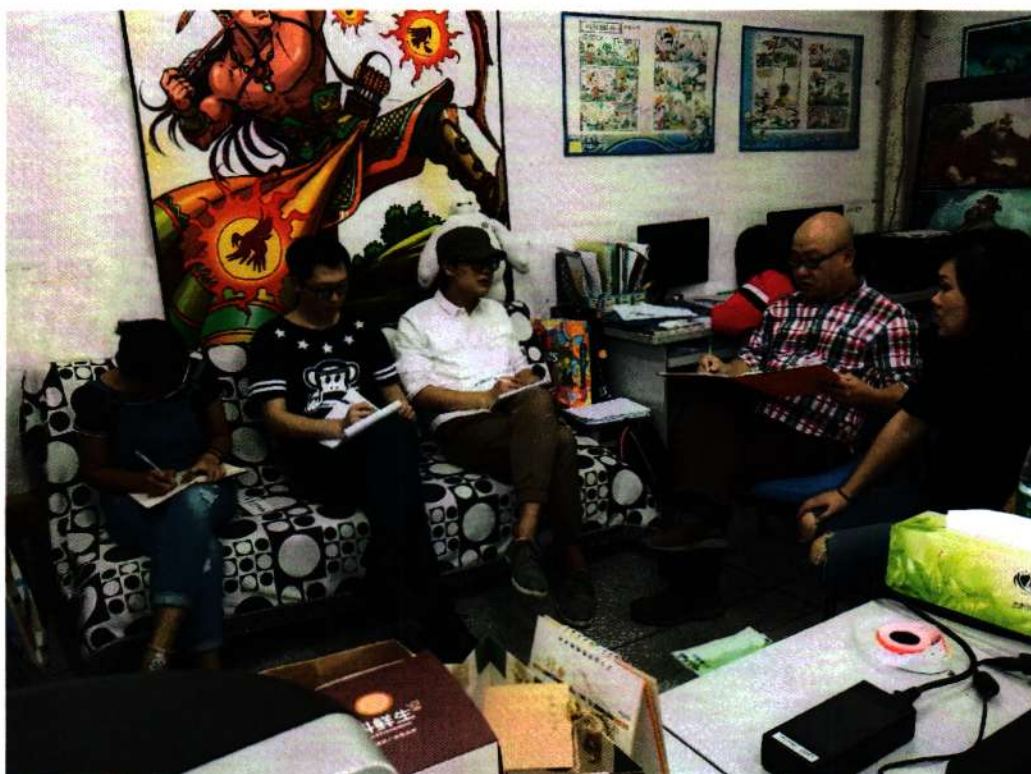
※计算机动漫与游戏制作项目组成员讨论