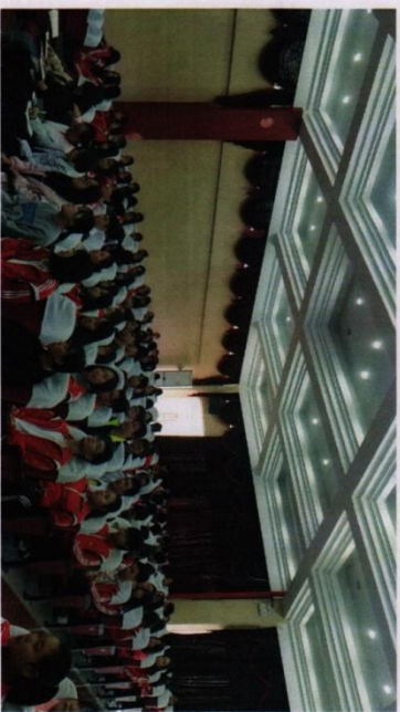
※工艺美术专业老师与专业部学生们听橱窗展示设计讲座