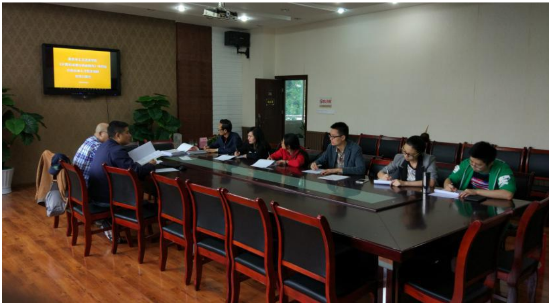
※计算机动漫与游戏制作项目组成员就行业企业人才需求调研