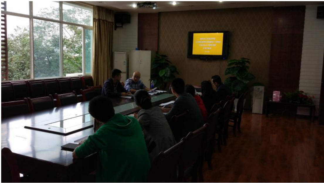
※计算机动漫与游戏制作项目组成员就行业企业人才需求调研