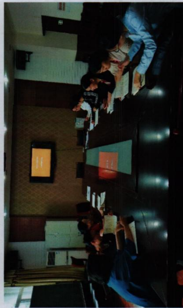
※工艺美术项目组教材编写分组讨论