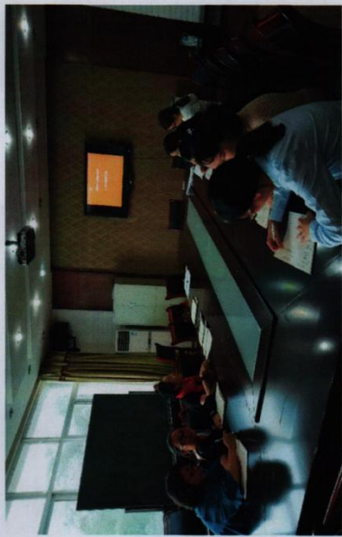
※工艺美术项目组对教材编写内容进行讨论