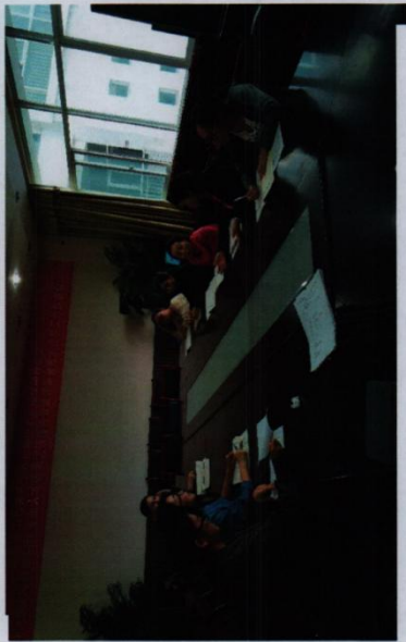
※工艺美术项目组对教材编写内容进行讨论