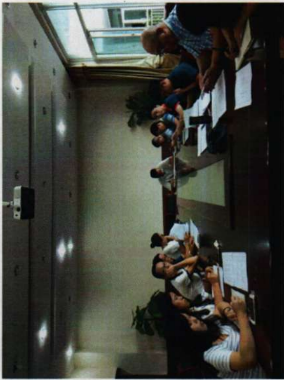
※计算机动漫与游戏制作项目组教师就示范校建设任务书解读