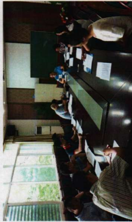
※计算机动漫与游戏制作项目组教师就示范校建设任务书解读