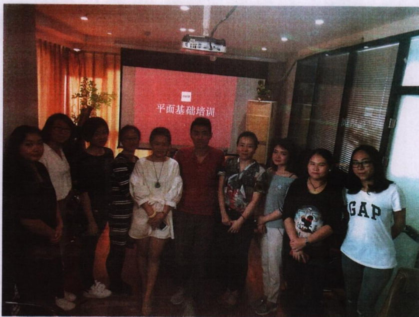
※工艺美术项目组与高戈广告公司项目经理课后合照