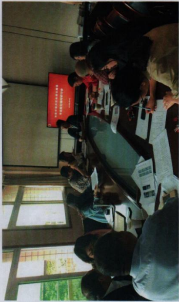
※专家到我校为两个示范专业项目指导教师教材编写