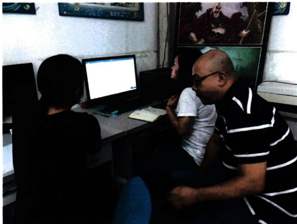
※项目组成员就核心教材编写进行讨论