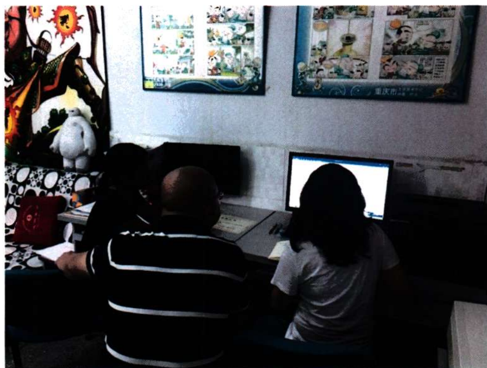
※项目组成员就核心教材编写进行讨论