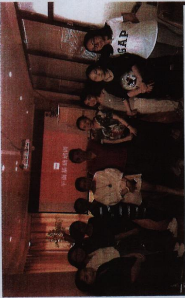
※工艺美术项目组成员与企业老师合影