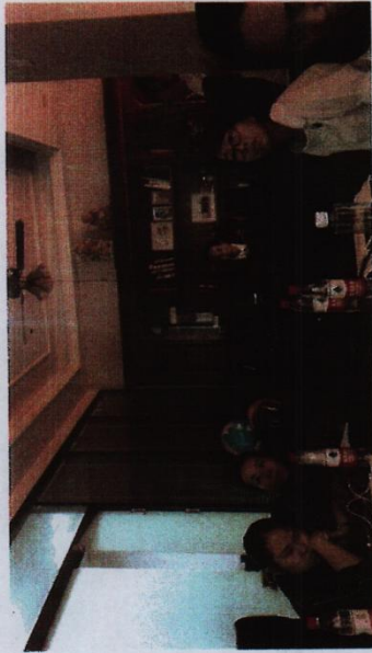
※工艺美术项目组赴重庆翰林墨影文化传播有限公司参加企业培训