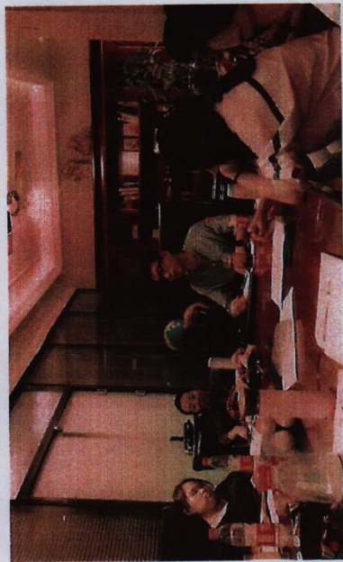
※工艺美术项目组赴重庆翰林墨影文化传播有限公司参加企业培训