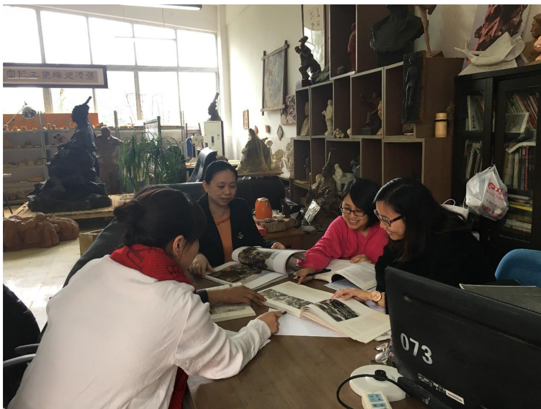
※项目组成员讨论校本教材编写事宜