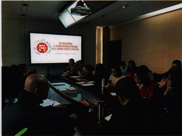
※人才培养方案试点总结暨人才培养方案修订研讨会照片