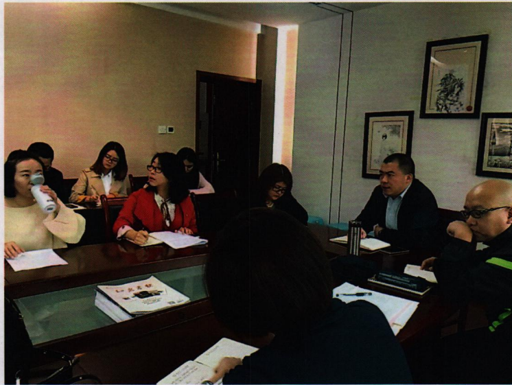
※人才培养方案试点总结暨人才培养方案修订研讨会照片