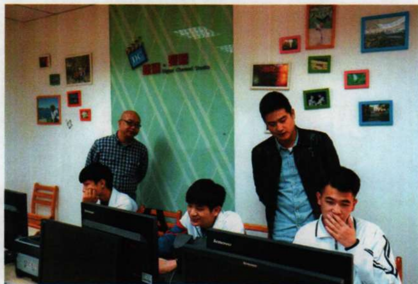
参观厦门信息学校的动漫游戏实训中心

期间主办方还组织参观考察了厦门信息学校的动漫游戏实训中心和厦门大拇指动漫股份有限公司。厦门信息学校（原福建省厦门电子职业中专学校）创办于 1981 年，厦门市教育局直属公办学校。2000 年被确认为国家级重点中等职业学校，2015 年 11 月被教育部人社部和财政部正式批复为国家中等职业教育改革发展示范学校。《计算机动漫与游戏制作专业》是国家示范重点建设专业。