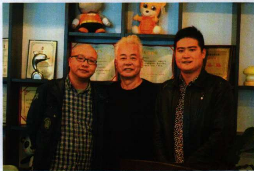
与日本著名漫画出版社“双叶社”编辑长栗原一二合影

司，总部落户于有“海上花园”和“东方夏威夷”美誉的厦门，公司伫立于厦门软件园内；是一家集动漫影视创意策划、动漫制作、版权发行、品牌授权、大拇哥家族动漫时尚馆、动漫教育培训、新媒体、电子商务的大型动漫产业机构。公司拥有从创意策划、动漫制作、影视后期一体化的艺术生产流水线，年动画生产能力达 5000 分钟以上，是目前海峡西岸综合实力最强、全国知名的动漫企业。日本著名漫画出版社“双叶社”编辑长栗原一二作为嘉宾，分享了日本漫画的发展经验。他一手打造了《蜡笔小新》、《鲁班三世》等动漫巨作，拥有丰富的漫画编辑技巧及经验。他回答了与会者提出的什么是一部好作品的问题。他说一部作品成功的关键就在于生动的角色和有创意的剧情，好作品是以生动的人物、精彩的情节来制造亮点，如果缺乏扣人心弦的效果，是不能提起读者继续欣赏兴趣的。