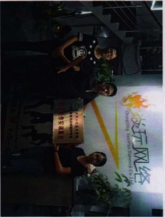
※计算机动漫与游戏制作项目组赴炫玩网络校企合作实训基地挂牌