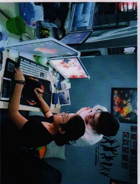
※计算机动漫与游戏制作项目组教师与企业师傅交流