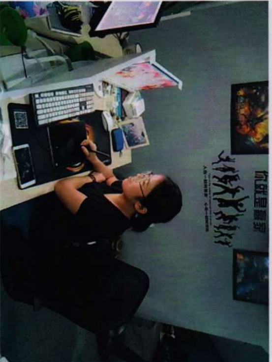
※计算机动漫与游戏制作项目组教师进行实训