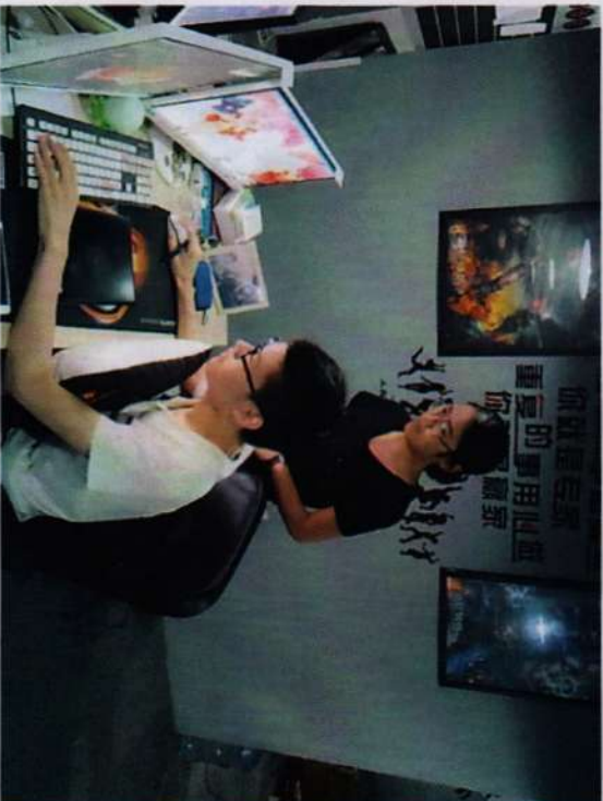
※计算机动漫与游戏制作项目组教师与企业师傅交流