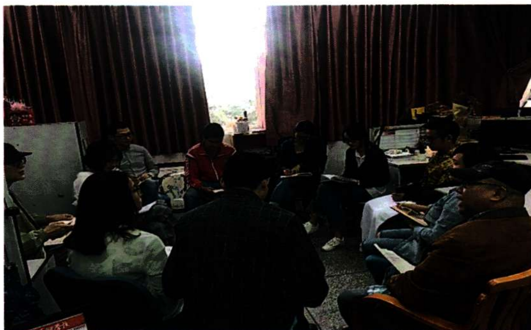
※计算机动漫与游戏制作项目组实训室管理制度研讨会