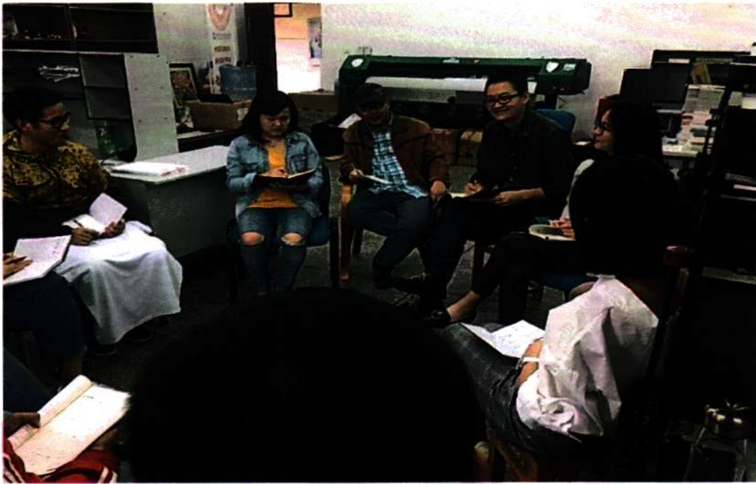
※计算机动漫与游戏制作项目组实训室管理制度研讨会